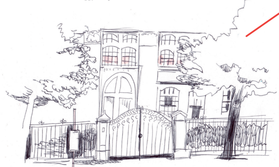
voortuin voormalige Rijksnormaalschool

tegen haar baby en roept iets naar het jongetje. Die hoort niet wat zijn moeder zegt. Hij kijkt naar de duiven die een beetje verderop neerstrijken. Hij wil achter de vogels aan, maar krijgt dan de oude man in de gaten. De kat schuurt langs de bejaarde benen. Ze mauwt zonder geluid. Het jongetje houdt zijn hoofd een beetje schuin en wijst naar de man. Terwijl de vrouw zegt dat wijzen niet beleefd is, kauwt de man rustig verder. En net voor hij richting duiven sprint, zwaait het jongetje naar de man. In paniek stijgen de duiven opnieuw op. Schaduwen dansen op een plein. Een jongetje schreeuwt het uit. Een vrouw met buggy berispt haar oudste kind en een oude man op een bank houdt plots op met kauwen. Hij zwaait naar een lege plek waar net nog de toekomst stond.